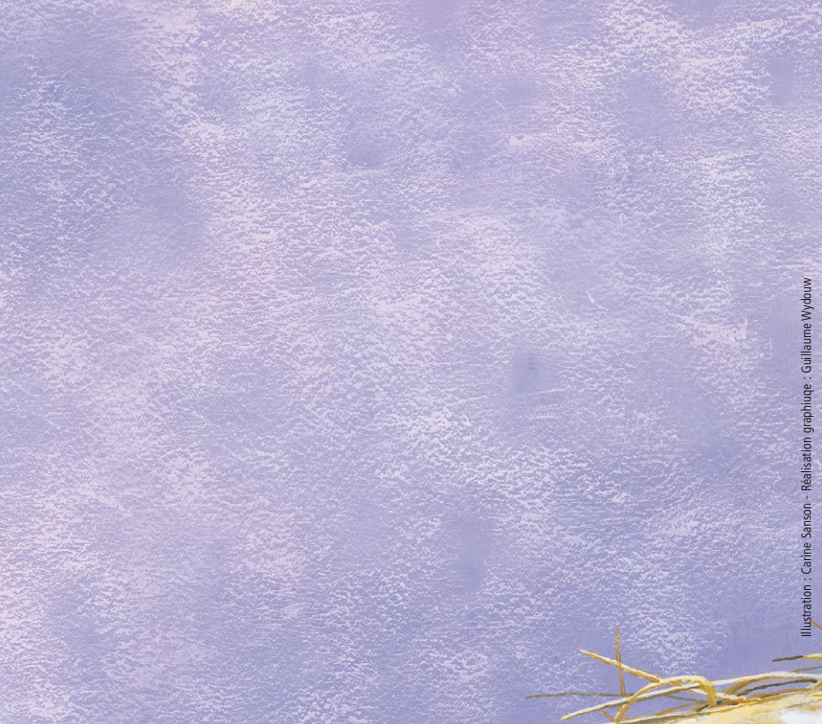
Illustration : Carine Sanson - Réalisation graphique : Guillaume Wydbuur

Les parties instrumentales des chansons de certains albums du label Enfance et Musique sont disponibles gratuitement sur demande à contact@aumerlemoqueur.com sur présentation par mail de la preuve d'achat de l'album concerné.